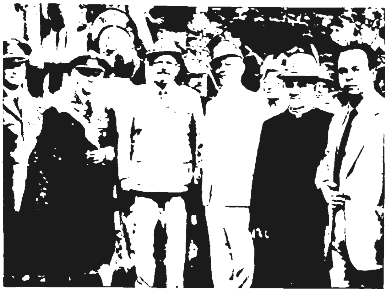
Il protonotario apostolico mons. Giovanni Corazza — al quale affettuosamente rinnoviamo l'augurio cordialissimo — durante una cerimonia al Bosco delle Penne Mozze.

Entrato poco dopo nel seminario di Treviso, consacrato sacerdote nel 1933 con prima assegnazione al Collegio Pio X di Treviso, don Corazza iniziò la sua lunga naja militare, spesso vissuta con gli alpini, nel febbraio del 1936. A tal punto la deserzione si farebbe lunghissima, per giungere a ricordare i compiti che — col grado di generale — svolse negli ultimi sette anni della sua quasi quarantennale vita militare, quale vicario generale dell'Ordinario militare